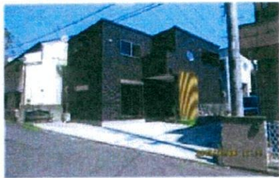
西側道路より撮影